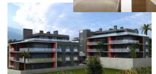
Edifício Séc. XXI 4