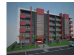
Edifício Séc. XXI 5