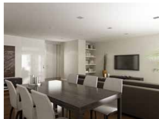
EDIFÍCIO SÉC. XXI 4 INTERIOR (IMAGEM 3D)