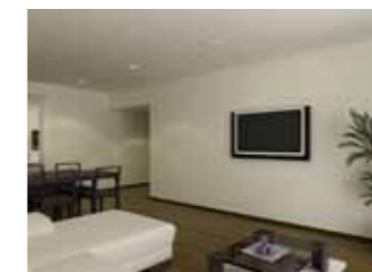
Edifício Séc. XXI 3