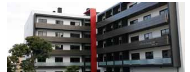
Edifício Séc. XXI 2

Depois de um 2009 marcado pelo abrandamento do mercado imobiliário os players do sector encontram-se empenhados em inverter a tendência sendo já visíveis alguns sinais de recuperação, desde os últimos meses do ano passado. Os dados do Índice Confidencial Imobiliário (ICI) , de Fevereiro último, revelam que a performance do mercado continua a ser positiva e que em comparação com os primeiros meses de 2009, os dois primeiros meses deste ano “apresentam valores mais altos do que aqueles que foram registados em igual período do ano passado” .