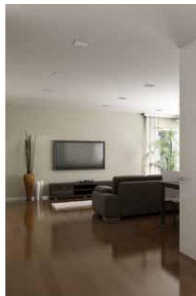
EDIFÍCIO SÉC. XXI 4 INTERIOR (IMAGEM 3D)

A qualidade da construção reflecte-se nos materiais e nos pormenores dos acabamentos que fazem toda a diferença. O resultado final apresenta-nos um edifício moderno, contemporâneo que se traduz na sabedoria de viver bem. O Edifício Séc. XXI 4 dispõe de Tipologias T2 e T3 .